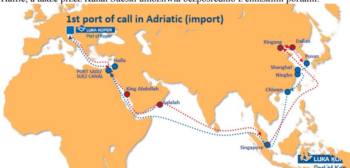
Grafika: Port w Koprze / Luka Koper

Rolę w wymianie handlowej Europa – Chiny odgrywać mogą też porty nad Adriatykiem. Port morski w słoweńskim Koprze, który od wielu lat stara się budować kooperację z polskimi partnerami. Port w Koprze kooperuje też w przeładunkach z portami w egipskiej Aleksandrii i Izraelskiej Haifie, a także przez Kanał Sueski umożliwia bezpośrednio z chińskimi portami.